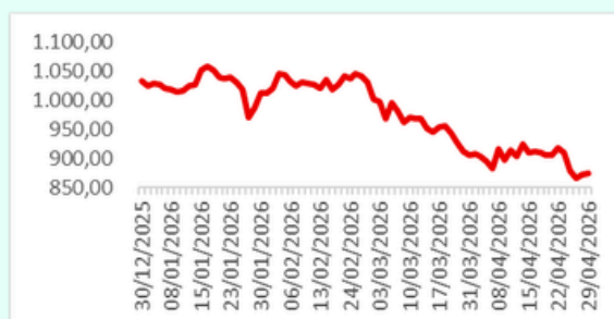
Infobank15 YTD Chart