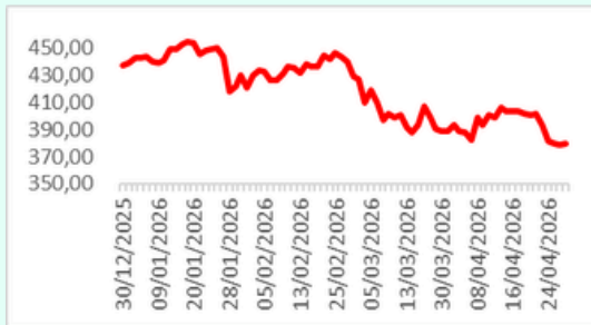
IDX30 YTD Chart