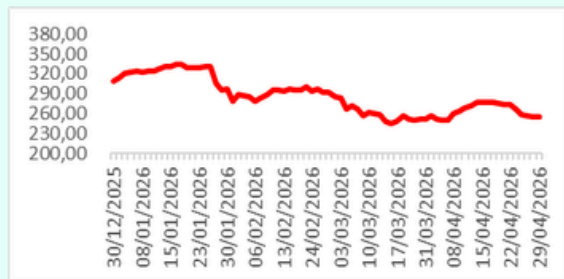
ISSI YTD Chart