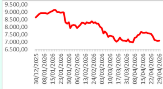
IHSG YTD Chart