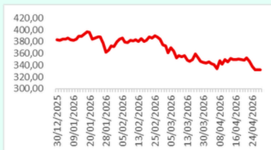
Sri-Kehati YTD Chart