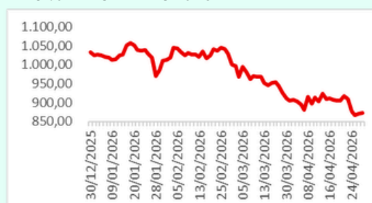
Infobank15 YTD Chart