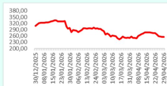
ISSI YTD Chart